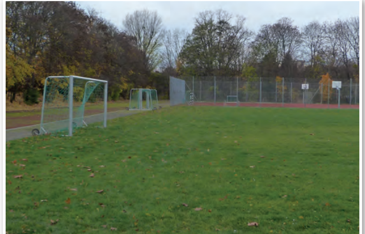
Auf der Deutschherrnwiese wurden von 1900 bis 1905 die Trainings- und Testspiele durchgeführt.