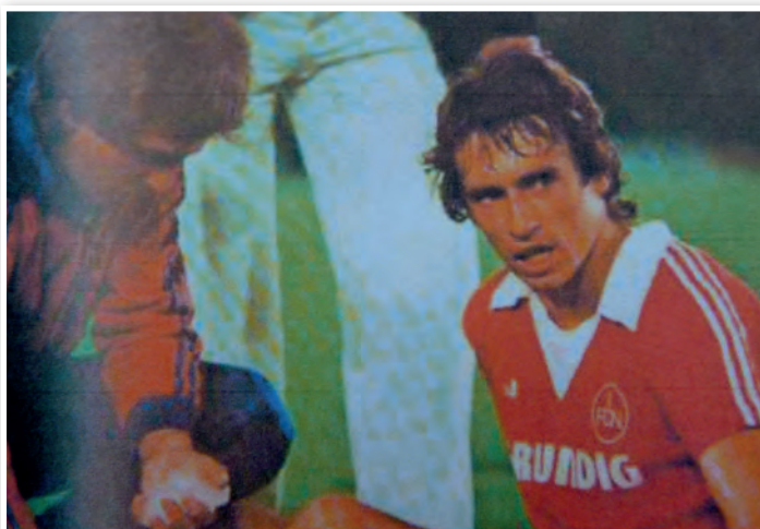
Norbert Eder während einer Behandlungspause im DFB-Pokal-Halbfinale gegen Düsseldorf.