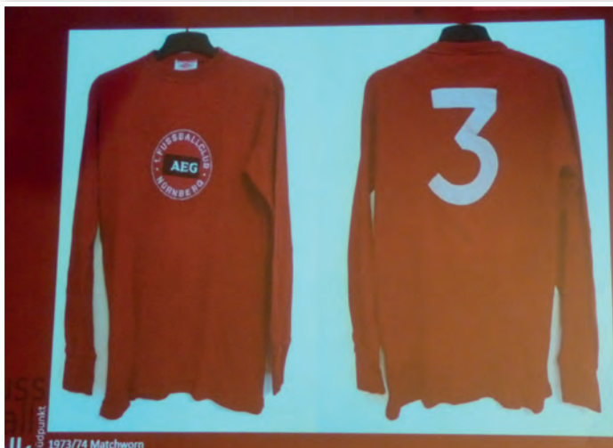
FCN In der Saison 1973-74 lief der Club erstmals mit der AEG als Sponsor auf