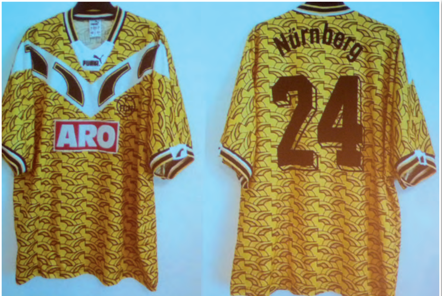
FCN - In der Saison 1995-96 trug Armin Störzenhofecker dieses bunte Teil