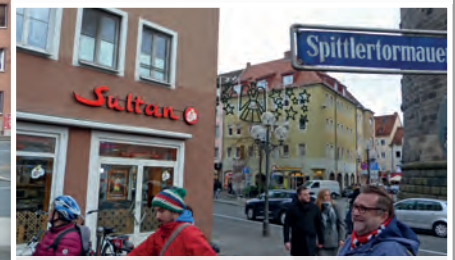
3 Jahrzehnte die „geheime Schaltzentrale“ des 1. FC N