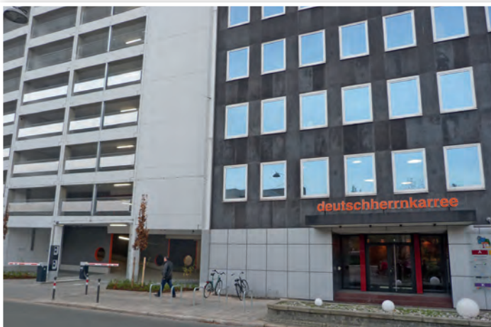
Am heutigen Deutschherrnkarree stand am 4. Mai 1900 die Gründungsgaststätte „Zur Burenhütte“.